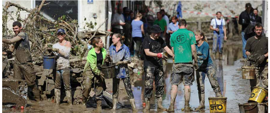
Aufräumarbeiten in Simbach am Inn