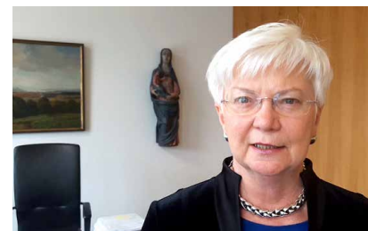
Gerda Hasselfeldt, 65

Das Thema ‚Autonomes Fahren‘ ist in der Zukunft keine Wunschvorstellung mehr. Ich glaube, dass wir schon bald dazu in der Lage sein werden, vor allem sicher und ohne Staus und völlig entspannt durch den Straßenverkehr zu kommen. Und ich bin ganz sicher, wenn wir weiterhin in Innovation, Forschung, Entwicklung und Wissenschaft die Rekordsummen investieren wie momentan, und vielleicht noch ein bisschen was oben drauflegen, dass so manche Träumerei zur Realität werden kann.